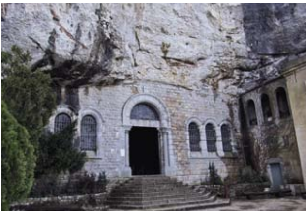
Entrée de la grotte.

Ces légendes populaires médiévales nous proposent des histoires qui nous paraissent à nous, hommes et femmes du XXI e siècle, un peu tirées par les cheveux (sans mauvais jeu de mots !) Mais elles nous apprennent beaucoup sur l'intérêt suscité par Marie-Madeleine au Moyen Age. Très populaire elle était donnée en exemple. Elle était vénérée d'abord pour son repentir et sa conversion, ensuite pour son grand amour envers le Christ. La Vierge Marie aussi était très vénérée, mais Marie-Madeleine incarnait une dynamique de conversion et le fruit du repentir. Elle offrait ainsi aux pécheurs, que nous sommes tous, un espoir tout humain, réel et possible.