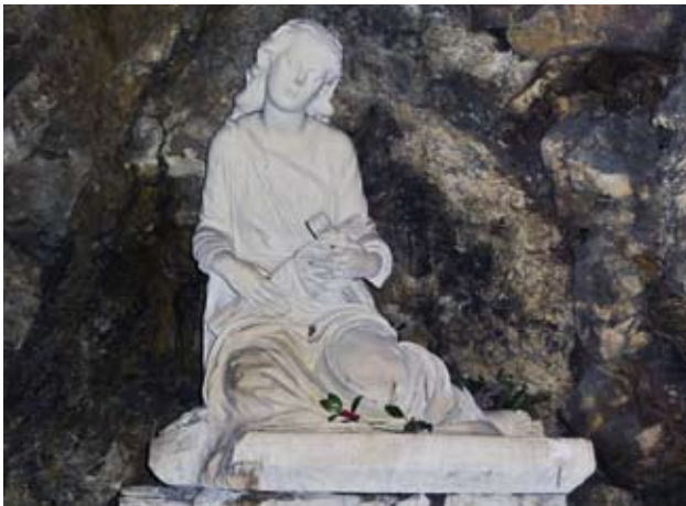
Marie-Madeleine en méditation dans la grotte.

à une habitation troglodyte, avec une façade sobre. A l'intérieur diverses statues de la sainte, le rocher naturel des parois y est très humide. De beaux vitraux contemporains de Pierre Petit sont visibles sur la seule partie recevant la lumière : la façade. Ils reprennent les épisodes de toutes les Marie fondues en une.