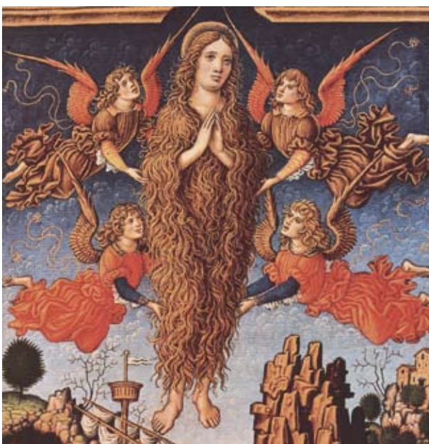
Marie-Madeleine est enlevée au ciel par les anges, détail, Livre d'heures des Sforza, XV e siècle.

Pendant ce temps, Marthe, en femme qui ne reste pas les bras croisés, nous la connaissons, enseigne aussi, remonte la vallée du Rhône et fait des miracles. Elle terrasse le dragon de Tarascon, la fameuse Tarasque, d'une aspersion d'eau bénite.